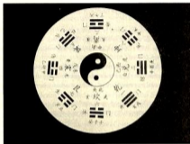
Abb. 1: Yin und Yang

vielen Anteilen Yang). In seinem Handeln wird sich der Mensch deshalb darum bemühen, die eigene Eigenschaft kompromisslos zu betonen, um sich erfolgreich mit dem dazu passenden Gegenpol verbinden zu können. Die Realität erfordert damit nicht Kontingenzbewältigung, sondern die Bemühung um einseitige Gestaltung dessen, was ist, und um Einfügung seiner selbst in einen Kontext, der die Regeln des Handelns diktiert.