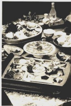
好評//ズワイガニ食へ放題と大露天風呂